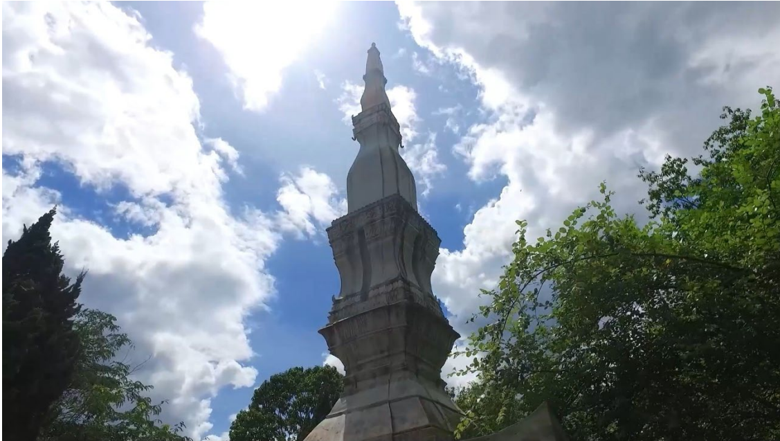
Tháp Mường Và thuộc bản Mường Và xã Mường Và

Và, hai mặt Tây Bắc của tháp là ngọn núi cao tựa thế tay ngai, hai mặt còn lại nhìn xuống bản Mường Và