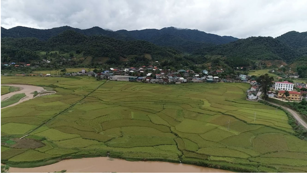
Cánh đồng lúa nếp Tan Mường Và

với mặt nước biển, đỉnh cao nhất 1.925m ở Pu Sâng xã Mường Lò, thấp nhất ở suối Nậm Công xã Sốp Cộp trên 700 m so với mặt nước biển. Các dãy núi dài và đứt gãy chạy theo hướng tây bắc - đông nam tạo ra các tiểu vùng có đặc điểm địa hình, khí hậu, đất đai, nguồn nước tương đối đa dạng.