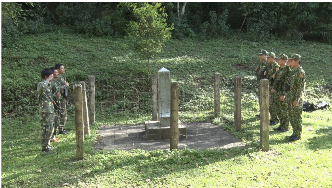
Tuần tra song phương giữa Đồn Biên phòng Mường Lạn và lực lượng biên phòng Lào