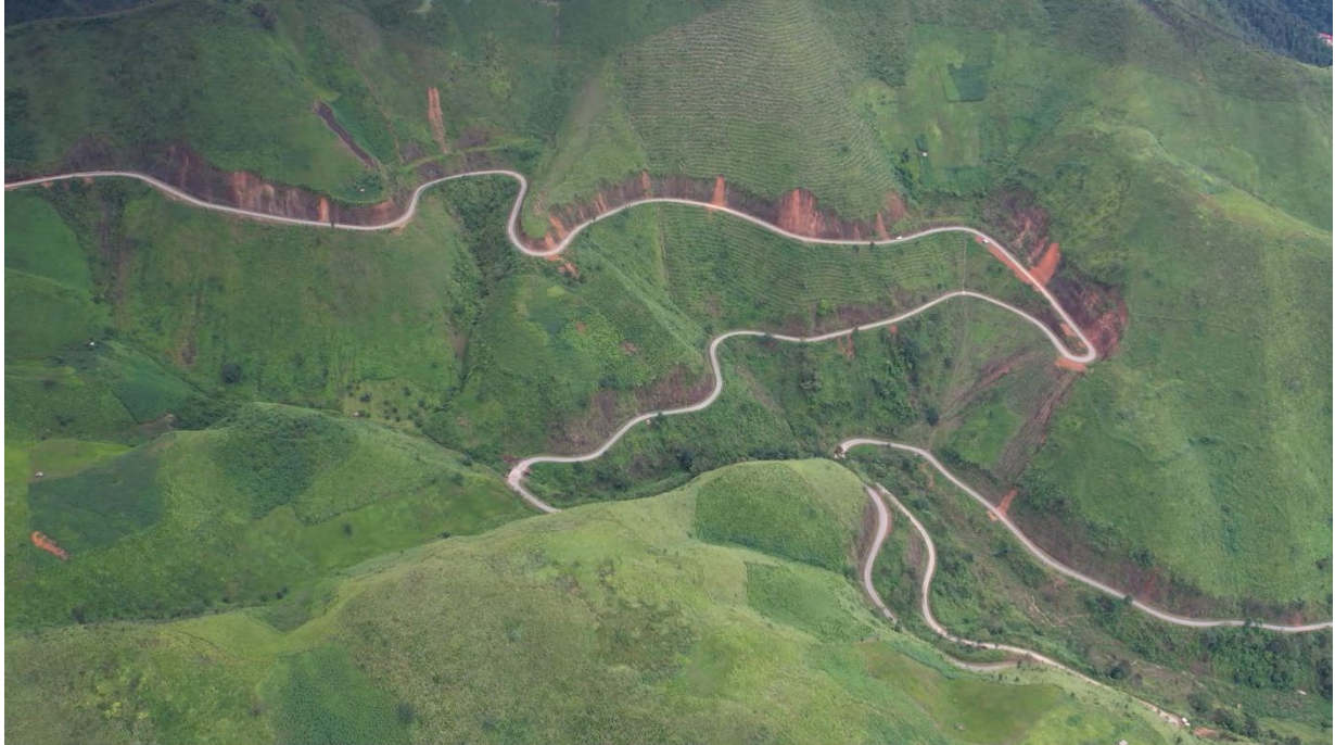
Dốc 3 tầng xã Mưòng Lèo