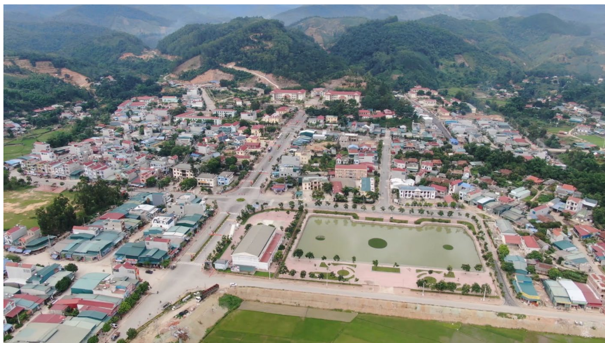
Trung tâm huyện Sốp Cộp hôm nay

Vùng Sốp Cộp trong lịch sử, nay là huyện Sốp Cộp luôn là một bộ phận không thể thiếu của Tổ quốc Việt Nam. Trong tiến trình phát triển, vùng Sốp Cộp có sự biến đổi về tên gọi, địa giới hành chính. Trước năm 1953, vùng Sốp Cộp là tổng Sốp Cộp thuộc châu Điện Biên, tỉnh Lai Châu... đến ngày 07/3/1953, Khu ủy Tây Bắc quyết định thành lập châu ( huyện ) Sông Mã, thuộc tỉnh Sơn La (xã Sốp Cộp từ tỉnh Lai Châu về tỉnh Sơn La).