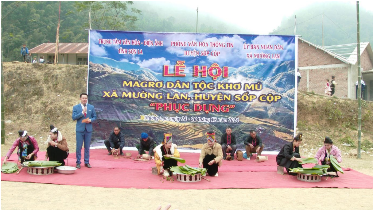
Lễ hội Magrô dân tộc Khơ Mú bản Huổi Lè xã Mường Lạn

Di tích lịch sử-văn hóa, danh lam, thắng cảnh.