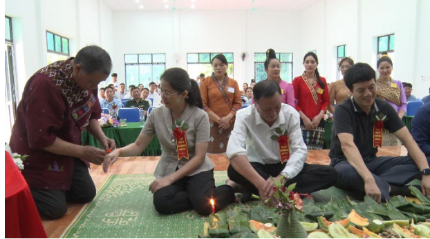
Lễ hội Khau Hó dân tộc Lào xã Mường Và