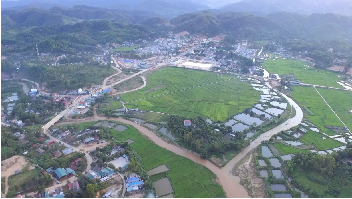
Hình ảnh từ trên cao 3 con suối gặp nhau