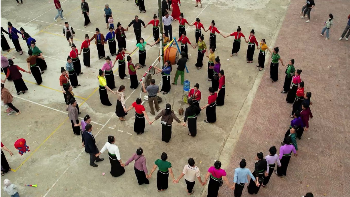
Vòng xòe đoàn kết nhân dân xã Sốp Cộp

Cộng đồng các dân tộc huyện Sốp Cộp luôn đoàn kết, chất phác, mến khách, rộng lượng và nhân ái, hăng hái, cần cù trong lao động sản xuất, anh dũng đấu tranh bảo vệ quê hương, đất nước.