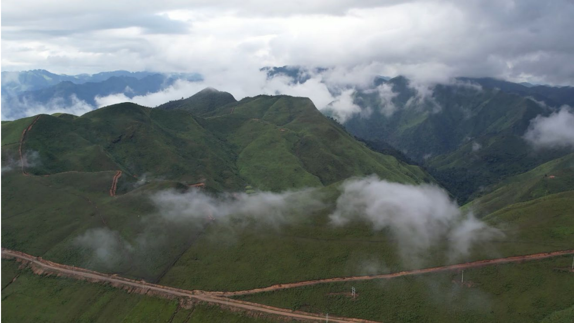
Cảnh đồng cỏ bản Sam Quảng xã Mường Lèo