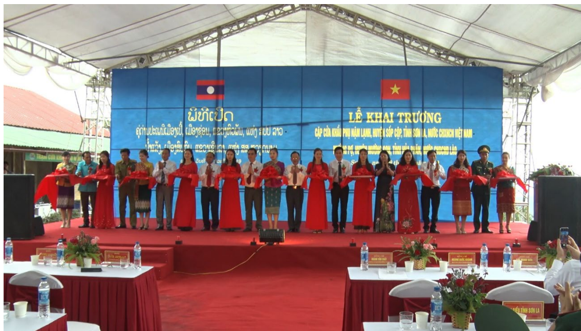
Cắt băng khánh thành Cửa khẩu phụ Nậm Lạnh